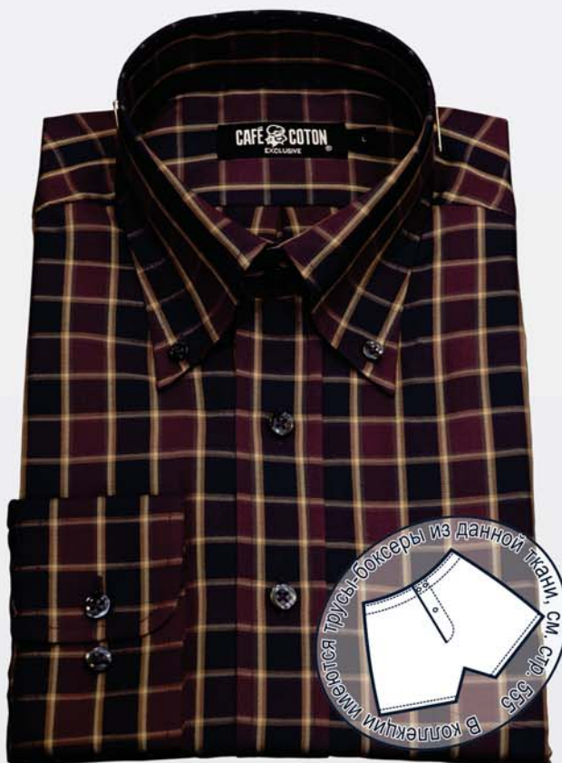
Andromède 18 (фиолетовый/голубой)