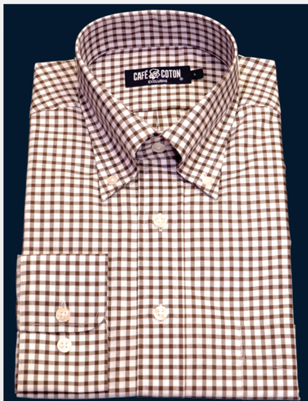
Cassiopée 13 (коричневый)