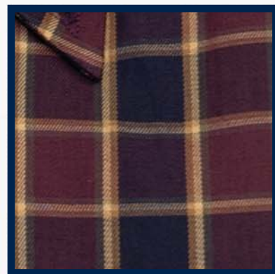
Andromède 10 (коричневый/голубой)