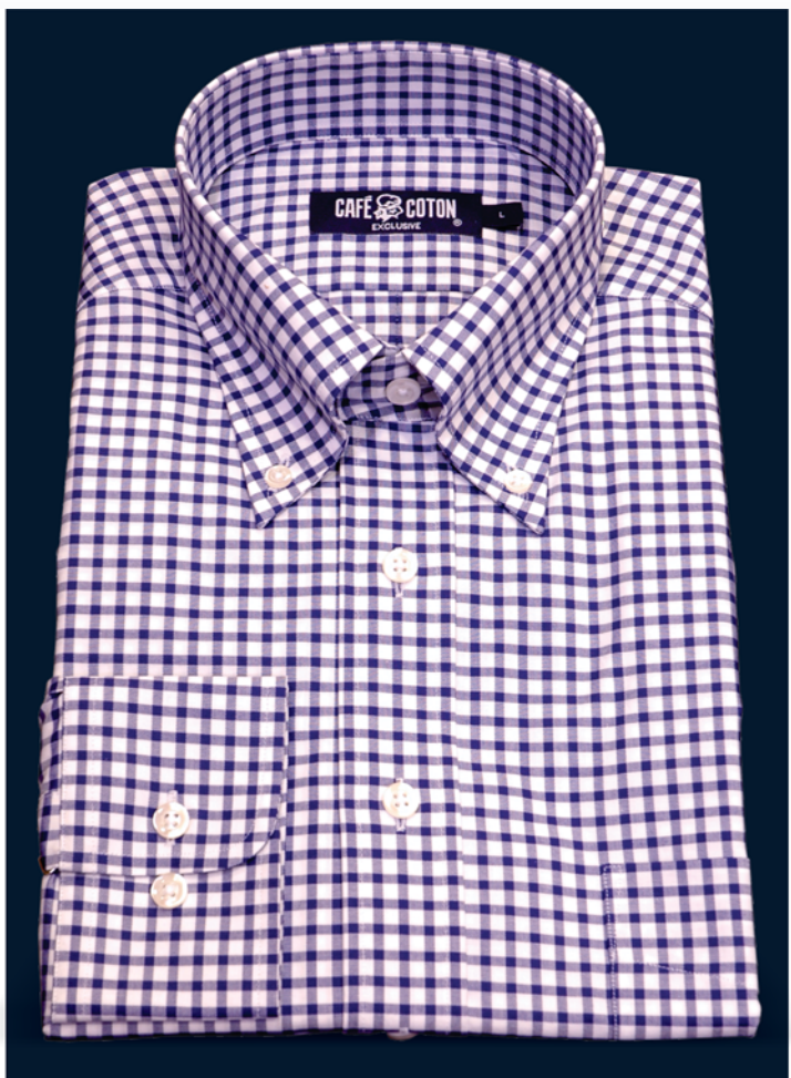
Cassiopée 5 (темно-синий)